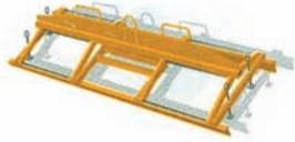
Çatı ve döşeme elemanı kavrayıcısı