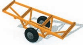
Çatı ve döşeme elemanı montaj arabası