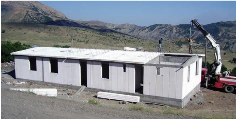
Taşıyıcı Düşey Duvar Elemanları