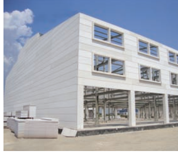
Yatay Duvar Elemanları