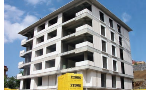
Düşey Duvar Elemanları