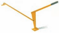
Çatı ve döşeme elemanı sıkıştırma manivelası