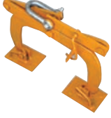
Yatay duvar kavrayıcısı