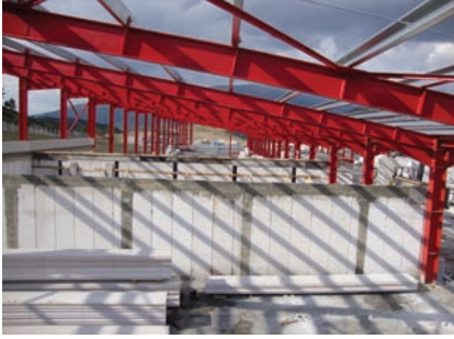
Düşey Duvar Elemanları